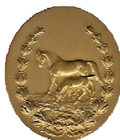
Staatspreis für Pferdezucht