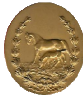
Staatspreis für Pferdezucht